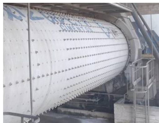
broyeur à boulets

Aujourd'hui, les écrous ESL sont utilisés en M30, M33 et M36 (pas fin) dans l'ensemble des cimenteries de l'entreprise, sans problème de qualité ni retard de production lié à des défaillances de boulons.